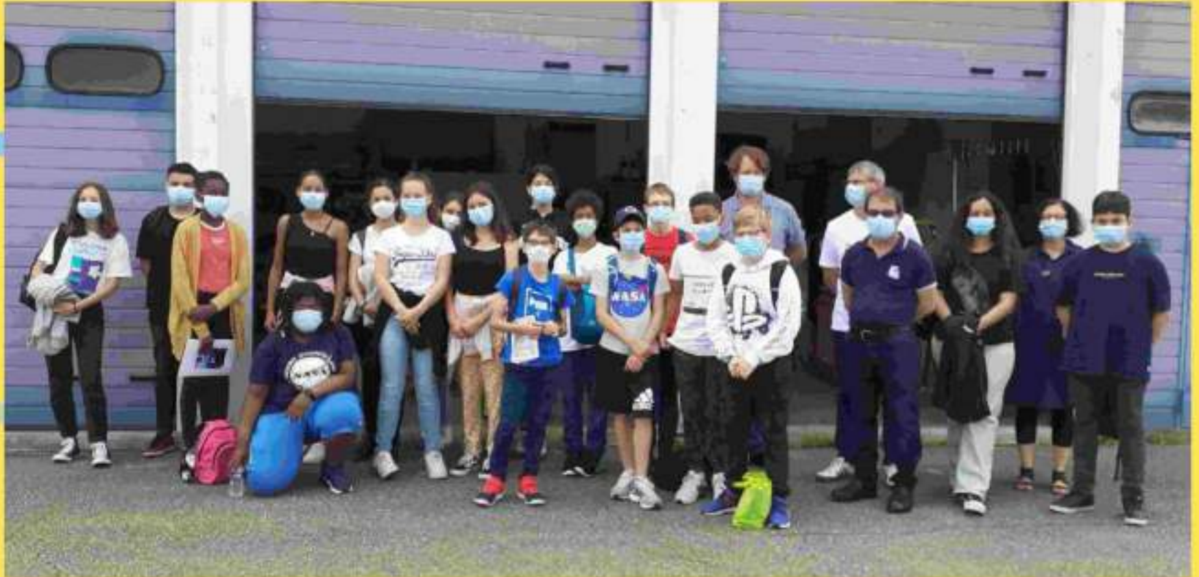
Le Club Sciences au CNRS d'Orléans et les deux ingénieurs du CNRS