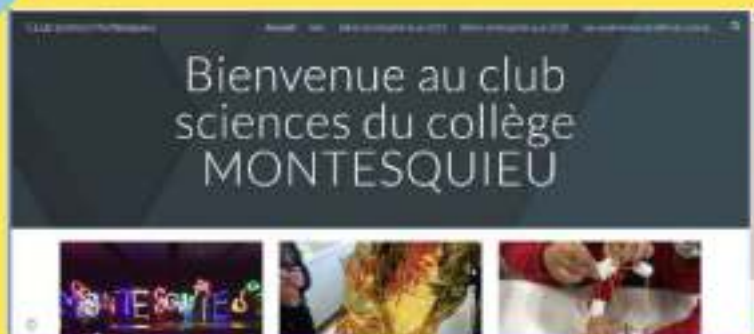
Site du Club Sciences