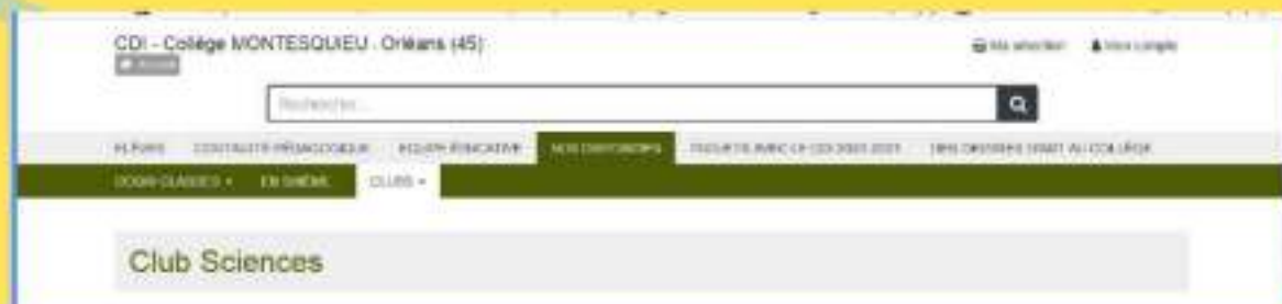
Site du CDI e-sidoc