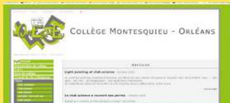
Site du Collège > Club Sciences